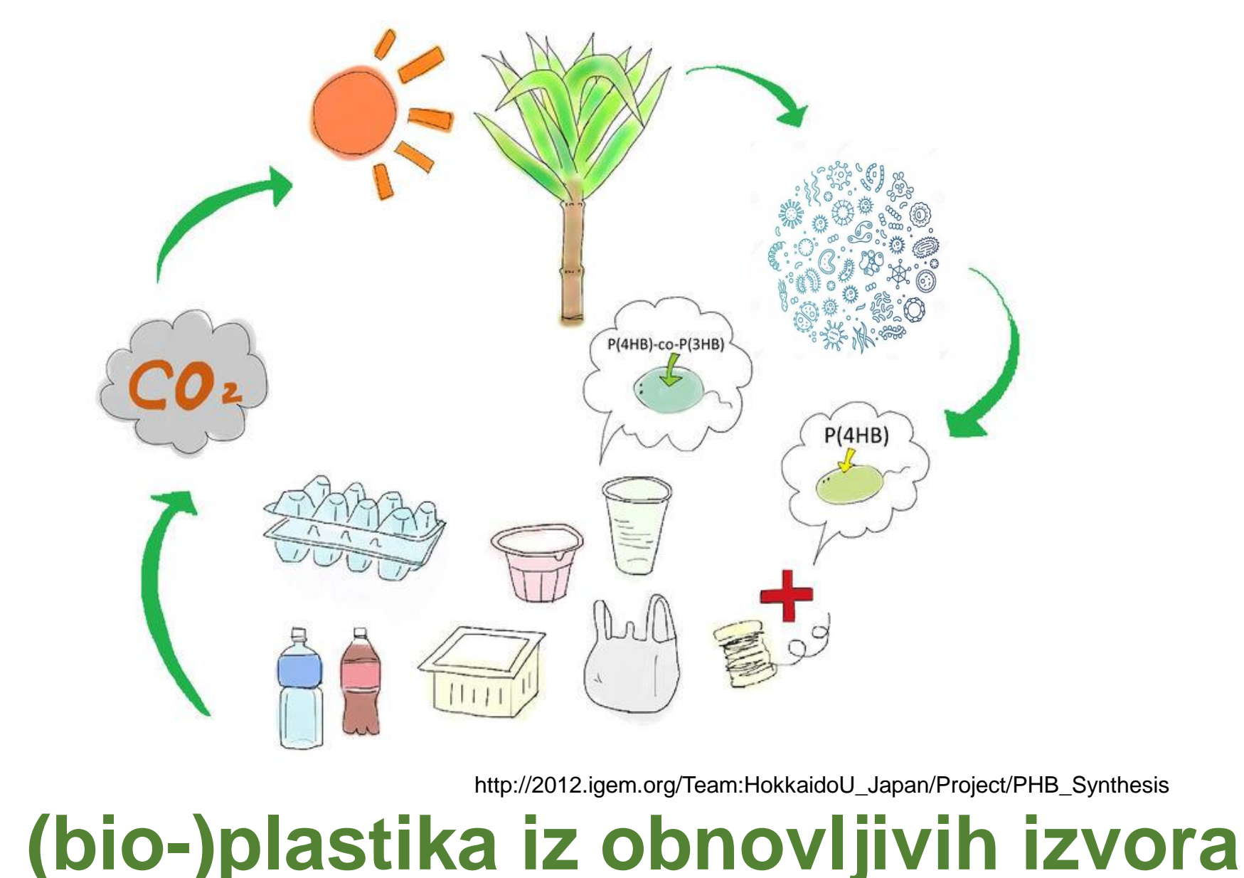
(bio-)plastika iz obnovljivih izvora

Jedna od glavnih podjela plastike je na razgradivu ( eng. degradable ), biorazgradivu ( eng. biodegradable ) i plastiku koja se može kompostirati ( eng. compostable ). Svojstvo biorazgradivosti plastike nije vezano uz podrijetlo materijala koje se koristi za izradu, nego direktno uz kemijsku strukturu polimera od kojeg je plastika sačinjena.