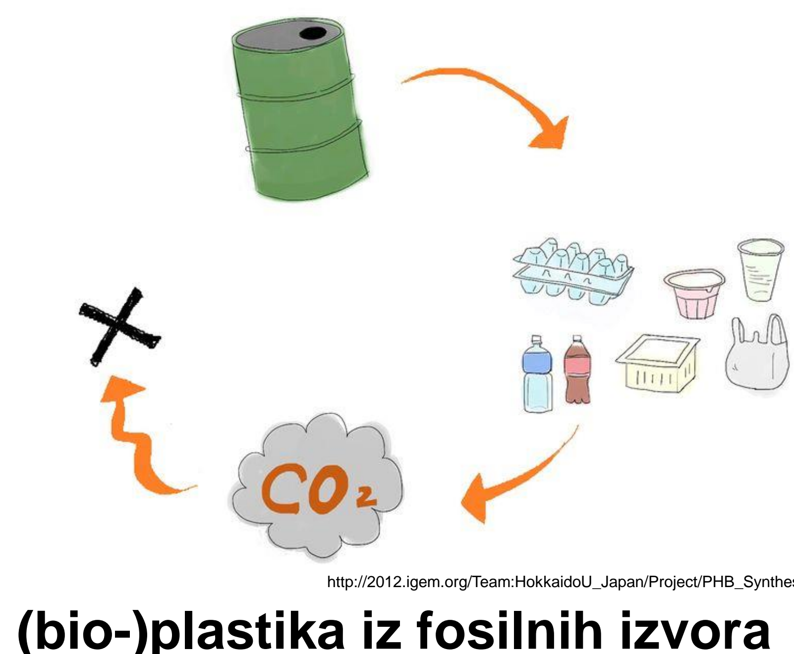
(bio-)plastika iz fosilnih izvora

plastika iz obnovljivih izvora vs. fosilna plastika